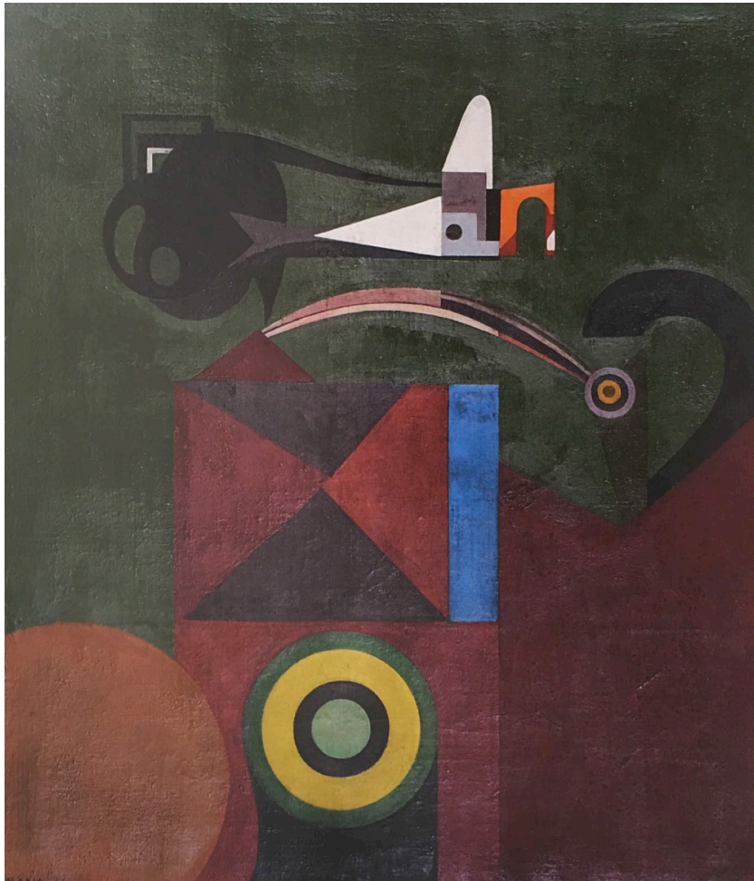
Fig. 3 - Nadir Afonso, Máquina de Sonhos , óleo sobre tela, 74x64, 1946.

se, por seu único mérito, no plano de uma pesquisa avançada que ia ao encontro, mesmo se intuitivamente, daquelas inquietações mais avançadas sentidas na arte europeia.