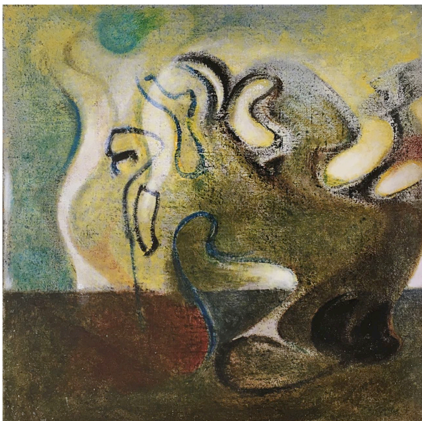
Fig. 2 - Nadir Afonso, Bruxedo , óleo sobre tela, 74x74, 1945.

De facto, a notícia da abstracção americana, que na década de cinquenta era já uma realidade incontornável no plano internacional, com reflexos recíprocos no pensamento estético europeu, jamais encontrou eco contemporâneo entre nós. Mais tarde, e já pelos finais dos anos cinquenta, alguma informação sobre a abstracção europeia teve enfim divulgação entre nós, vindo a tornar-se referencial apenas na década seguinte e mesmo assim para poucos artistas. Mas, infelizmente, sem trazer consigo uma consciência activa das suas razões estéticas mais profundas. Ou seja, penetrou, de facto, mas mais como uma moda que chegava do que como uma tendência estética e sensível que se afirmava e que conseqüentemente abria novos horizontes.