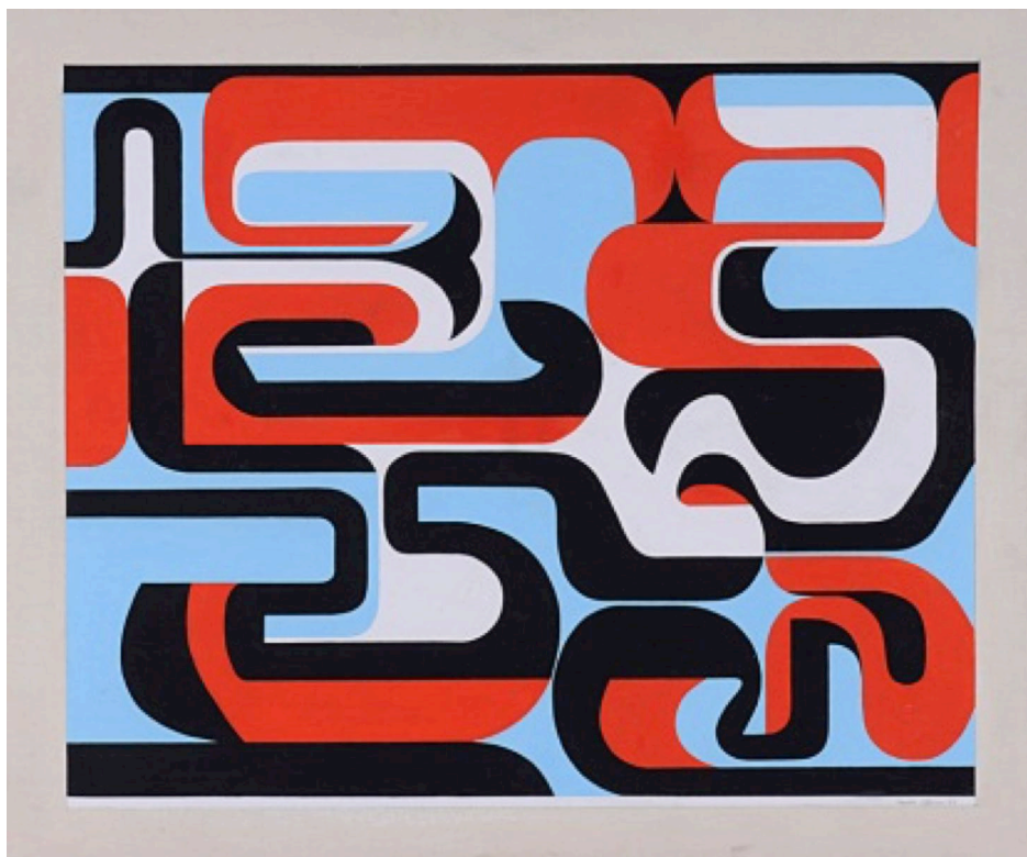
Fig. 4 - Nadir Afonso, Flora , óleo sobre tela, 83 x 98,5 cm, 1953.

Na verdade, saído de um primeiro envolvimento juvenil com um certo sentido quase surrealizante da criação plástica que se manifestara nos seus inícios, ainda na década de quarenta, a obra de Nadir evoluiria, quase naturalmente, para uma estilização de linhas e de definições construtivas muito nítidas que a conduziriam directamente para um sentido abstractivo.