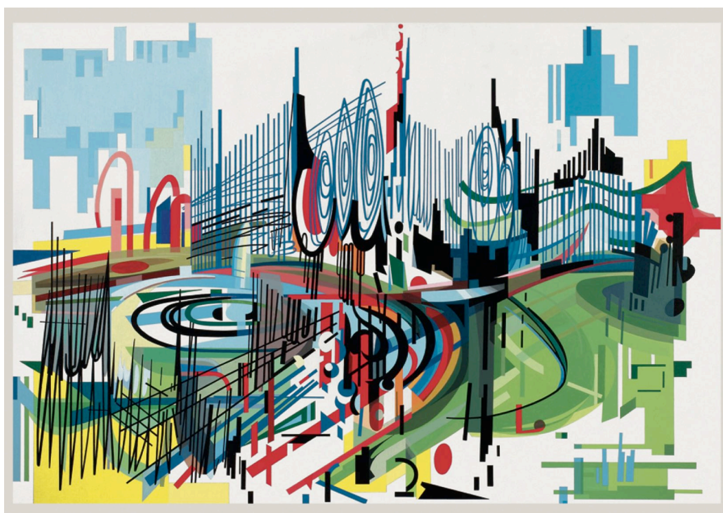
Nadir Afonso, A Cidade dos Príncipes , acrílico sobre tela, 96x135, 1999.

Obras próximas do que se poderia chamar uma abstracção musical, já que o papel das notações é aí muito grande, parecendo mesmo que os planos criados pelas cores evoluem segundo variações tímbricas que poderiam rimar com zonas de pura experimentação musical, elas revelaram um artista maior que se mostrava capaz de integrar inventivamente na sua obra a herança formal da primeira abstracção europeia - Kandinsky, Malévich, Arp e Mondriaan - ao mesmo tempo que renovando-a num sentido neo-constructivista e serial que o colocava a par das principais correntes da nova abstracção europeia, nomeadamente daquela que se reuniu, como atrás já referi, em torno da exposição "Mouvement" que Denise Renée abriu em 1955. Essa originalidade, de que rapidamente colheria o eco merecido, permitiu a Nadir integrar-se europeicamente desde muito jovem e ultrapassar o limite das fronteiras artísticas portuguesas muito antes que a restante arte feita em Portugal compreendesse o valor da pintura abstracta.