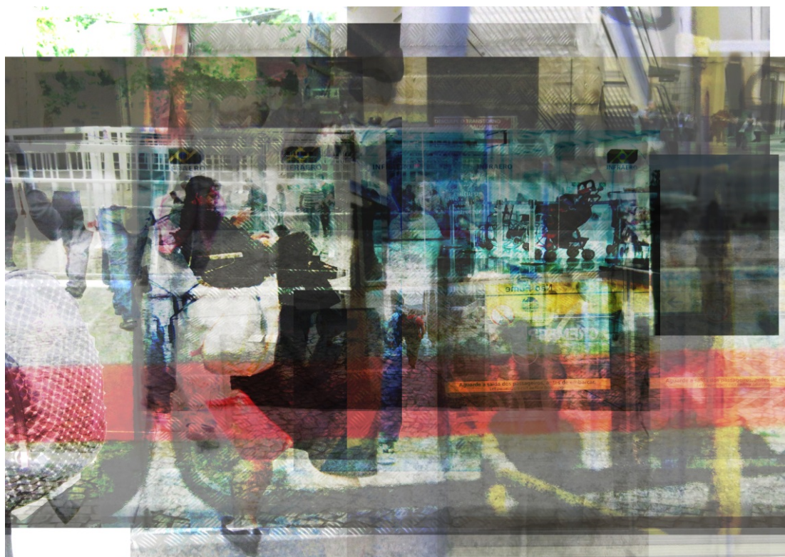
Figura 5: “9.2 Camadas de Tempo” da Série Trânsitos Urbanos ; fotografia digitalizada, 2014.

A obsessão pelo tempo se acentua em “Trânsitos Urbanos”, quando a coleta de imagens resulta em um vasto acervo fotográfico digital de viagens e movimentos do cotidiano. Interferindo no processo de impressão e interrompendo os métodos de reprodutibilidade fotográfica, o processo de labor almejou refletir uma paisagem única que condensasse cada um desses instantes. Partindo desse processo de experimentação, o trabalho abusou de gestos repetitivos, de camadas superpostas e de uma materialidade etérea com resultados imprevisíveis, reforçando o processo dos acontecimentos em constante transformação. Des-territorializações e re-territorializações na velocidade das relações e conflitos urbanos, novos modos de perceber essa paisagem algo que pode ser construído o tempo todo.