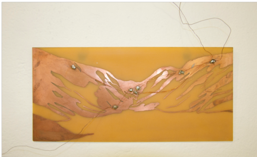
Figuras 2: Instalação “Circuitos Locais” , (detalhe), desenho em placa de fenolite, e fios de cobre, dimensão aproximada 0,20 X 0,30 m.