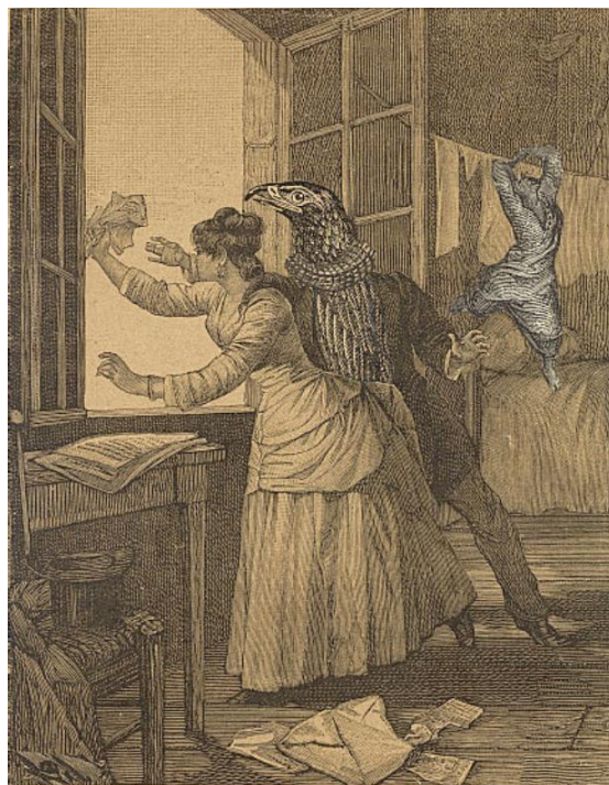
Imagem 2 - Max Ernst. Une Semaine de Bonté , 1934.

Outro trabalho do artista alemão, Une Semaine de Bonté (1934), emerge como mais uma obra que pode ser considerada referência para as experiências plásticas de Lima. Desse modo, pensando num quadro temporal, as publicações de Ernst poderiam ser situadas no interior do período de concepção e fatura das imagens do poeta brasileiro, tendo em mente que este trabalhou nas fotomontagens desde pelo menos 1937 até 1943, data da publicação do livro que as reúne. Jorge de Lima, em entrevista para a revista ilustrada O Cruzeiro , faz uma associação entre fotomontagem (que ele chama de fotografia) e poesia, ao mesmo tempo que se refere a Ernst: