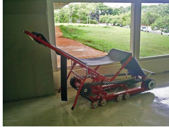
Equipamento especial para ser usado em caso de incêndio, para a retirada rápida e segura do usuário