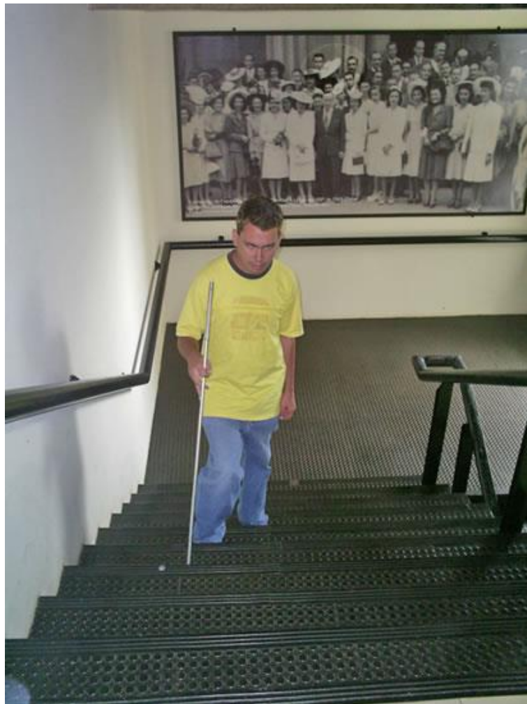
Usuário chegando ao Laboratório de Acessibilidade da Biblioteca Central Cesar Lattes