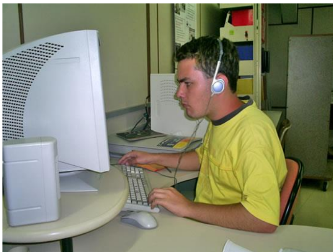
Os recursos de síntese de voz, através do Programa DOSVOX, permite aos usuários com deficiência visual a interação com o computador