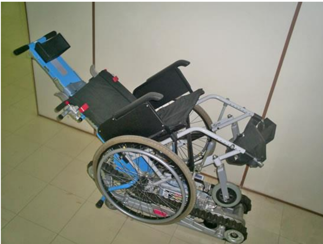
Equipamento usado para deslocamento do usuário pela escada, caso o elevador esteja quebrado