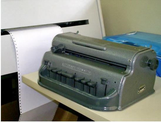
Impressoras possibilitam a impressão em Braille de qualquer texto digitalizado