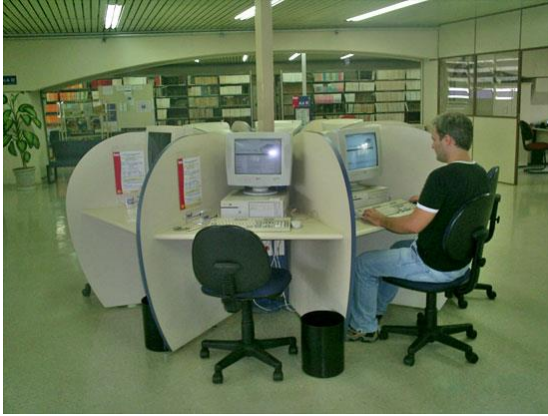
Acesso a Base de Dados na Biblioteca da área de Engenharia