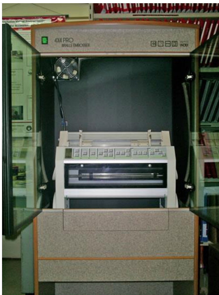
Impressoras possibilitam a impressão em Braille de qualquer texto digitalizado