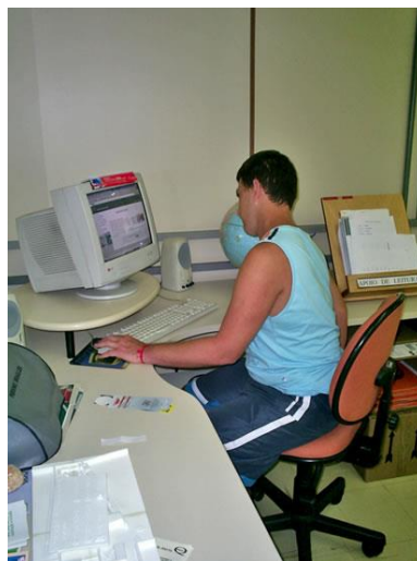
Usuário externo com problemas motores consultando as Bases de Dados