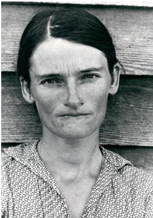
Sherrie Levine (Walker Evans) Ink jet print, 10.5 x 7.5", 2001