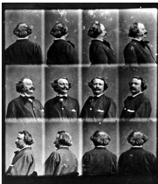
Nadar. "Auto-retrato com giro" cerca de 1865. Biblioteca Nacional da França, Paris

Ao usar esse tipo de argumentação, Nadar reclamava para si o status de artista e, logo, de autor, demonstrando que sua prática não se confundia com a função corriqueira atribuída à fotografia desde 1839. Se, em termos gerais, a fotografia era considerada uma reprodução do real, Nadar inscrevia sua prática no reino do espírito: suas imagens eram fruto de uma composição cuidadosa e tinham a capacidade de transmitir um sentimento, cuja raiz deveria ser procurada na transformação das aparências levada a cabo pelo fotógrafo.