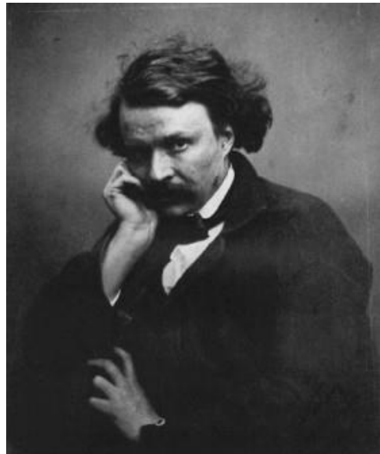
Nadar: Self-Portrait (Metropolitan Museum of Art, c. 1855)

Em 1857, o fotógrafo Félix Tournachoun move uma ação contra o irmão mais novo Adrien, para evitar que este usasse o pseudônimo que o tornara famoso: Nadar. Na Reivindicação da propriedade exclusiva do pseudônimo Nadar , o fotógrafo estabelece uma clara distinção entre a fotografia como técnica, "cuja aplicação está ao alcance do último dos imbecis", e a fotografia como arte. Enquanto a primeira podia ser facilmente aprendida - a teoria fotográfica podia ser adquirida