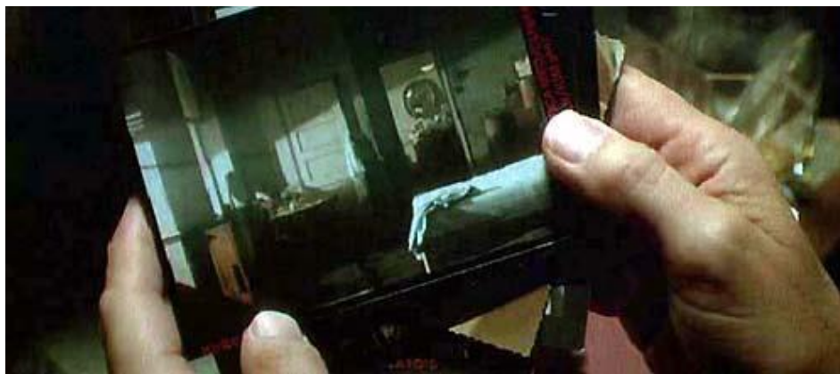
Foto encontrada no apartamento do replicante Leon: composição da imagem remete às pinturas dos holandeses van Eyck e Vermeer – este, suspeita-se hoje, pode ter utilizado os artifícios da câmara escura em sua arte.