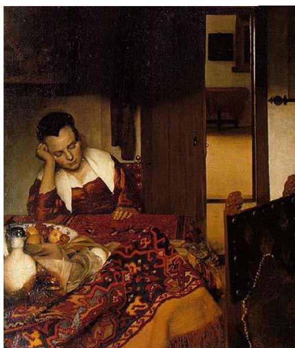
A Girl Asleep (87x76, 1657, New York, Metropolitan Museum).

Finalmente, algumas seqüências adiante no filme de Scott, chegamos ao objeto principal de nossa análise: a seqüência do Esper Machine 4 , como também ficou conhecida a passagem em questão. Deckard encontra-se agora