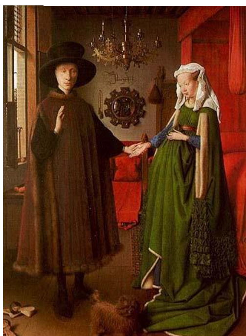
The Marriage of Gian Arnolfini and Giovanna Cenami (óleo sobre madeira, 81.8 x 59.7 cm, National Gallery, London).