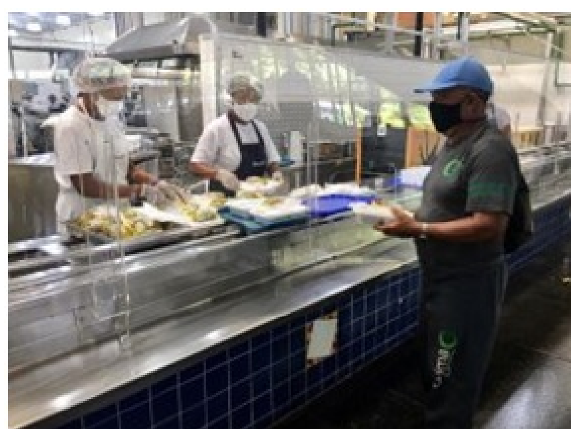
Distribuição de marmitas a funcionários de empresas terceirizadas durante a pandemia.

A atuação da Divisão de Alimentação/Prefeitura Universitária no enfrentamento da covid-19 foi imprescindível para a permanência estudantil dos bolsistas, e para manter o fornecimento de refeições aos profissionais das áreas essenciais, da saúde, e participantes da Força Tarefa-covid-19. As ações também incluíram a elaboração de protocolos de atendimento no novo contexto da Universidade, a revisão de Procedimentos Operacionais Padronizados, considerando as Notas Técnicas Específicas da ANVISA e orientações do CVS, e a elaboração de Cartilha de Orientação de uso dos RUs para a Retomada Segura.