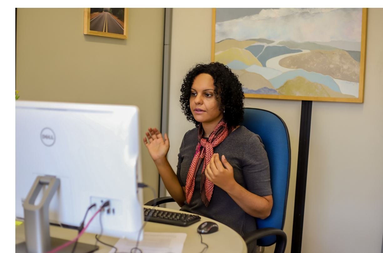
Figura 2 - Gravação de treinamento on-line do módulo SIGAD-Processos Digitais

Referências: BRASIL. Lei nº 12.527, de 18 de novembro de 2011. Regula o acesso a informações. Brasília, DF: Presidência da República, 2011. BRASIL. Lei nº 13.709, de 14 de agosto de 2018. Lei Geral de Proteção de Dados Pessoais (LGPD). Brasília, DF: Presidência da República, 2018. CONARQ (Brasil). Câmara Técnica de Documentos Eletrônicos. e-ARQ Brasil: Modelo de Requisitos para Sistemas Informatizados de Gestão Arquivística de Documentos. v.2. Rio de Janeiro: Arquivo Nacional, 2022. UNIVERSIDADE ESTADUAL DE CAMPINAS. Resolução GR-028/2015, de 22 de setembro de 2015. Aprova a implantação do Sistema Informatizado de Gestão Arquivística de Documentos da Universidade Estadual de Campinas (SIGAD/UNICAMP) no âmbito das unidades e órgãos, com operação e controle automatizados. Campinas: Unicamp, 2015.