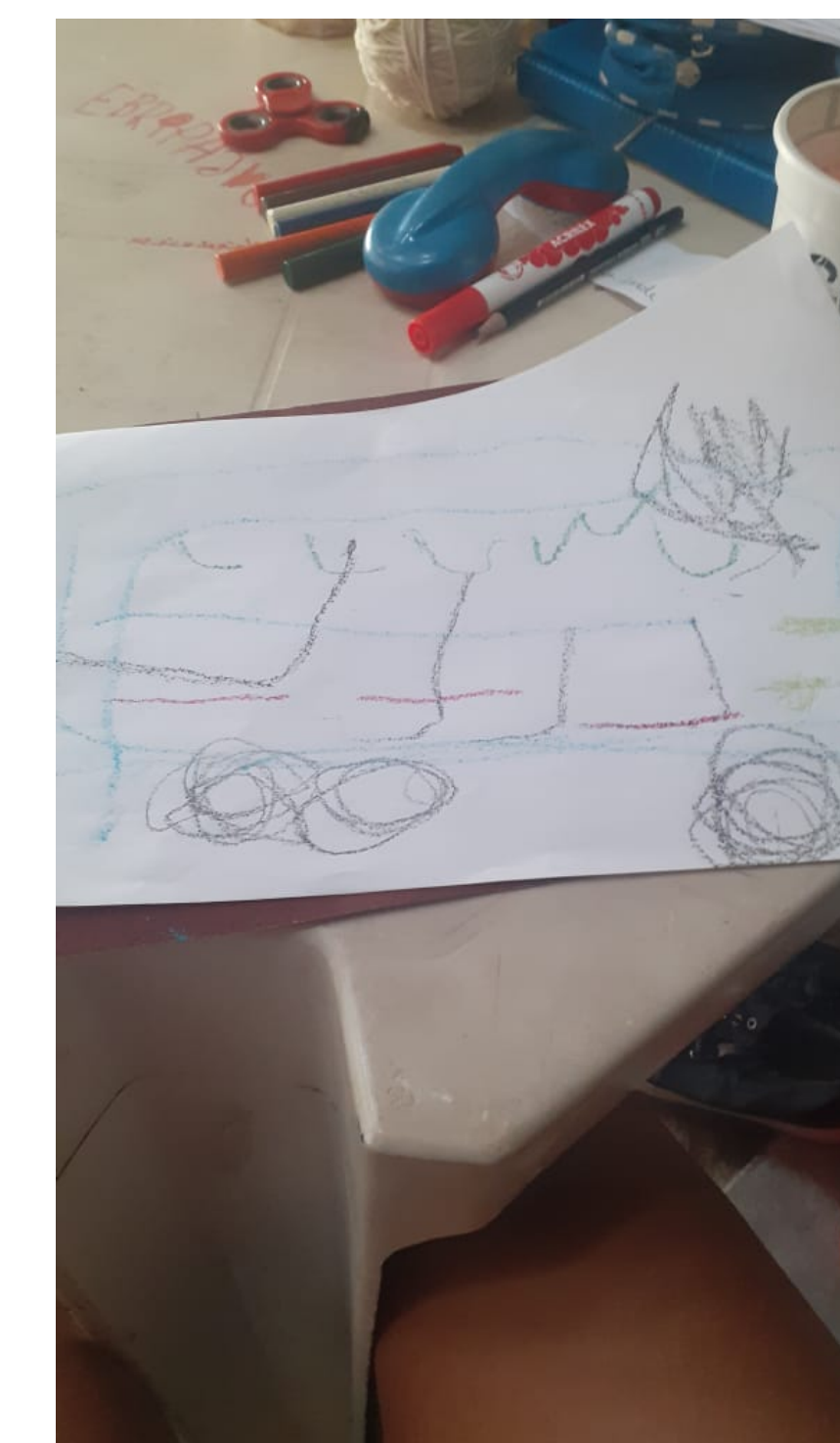
Figura 2: desenho de um ônibus.