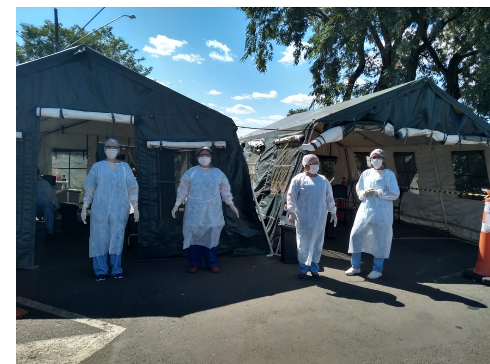
Equipe enfermagem na tenda de triagem para COVID-19.

Referências: CASTRO, E. de S. M.; OLIVEIRA, F. das C. S. de; VIANA, M. R. P. . Urgentist Nurse Actions in the Fight Against COVID-19. Research, Society and Development, [S. l.], v. 10, n. 6, p. e38310615855, 2021. DOI: 10.33448/rsd-v10i6.15855. Disponível em: https://rsdjournal.org/index.php/rsd/article/view/15855 . Acesso em: 8 sep. 2022. World Health Organization (WHO). Emergencies preparedness, response: Novel Coronavirus – China - Disease outbreak news: Update, 12 January 2020. [Internet]. 2020 [cited 2020 Jun 17]; Available from: https://www.who.int/csr/don/12-january-2020-novel-coronavirus-china/en/ .