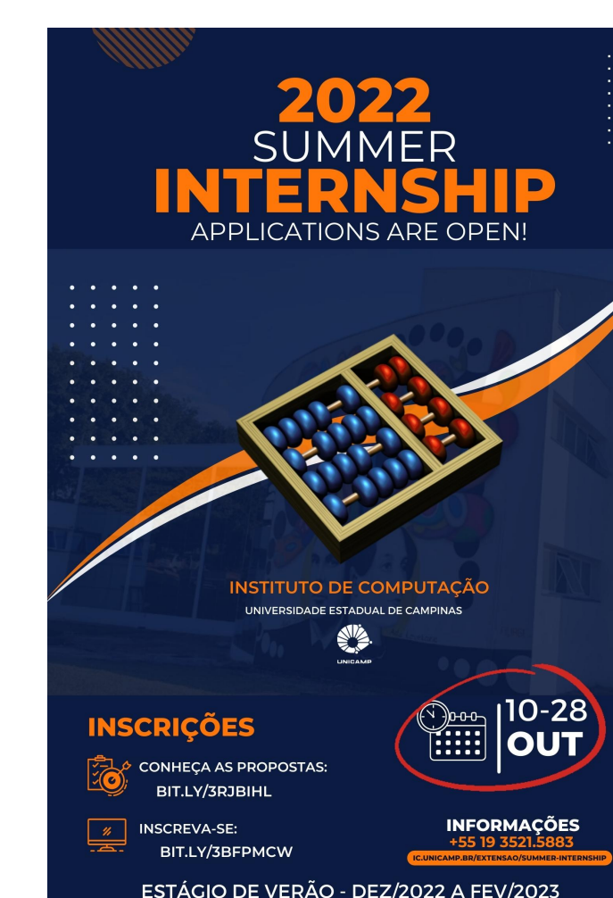
Cartaz de divulgação do Programa e chamada de inscrição aos alunos.

Referências: [1] BRASIL. Lei nº 11788, de 25 de setembro de 2008. Dispõe sobre o estágio de estudantes; altera a redação do art. 428 da Consolidação das Leis do Trabalho – CLT, aprovada pelo Decreto-Lei no 5.452, de 1º de maio de 1943, e a Lei no 9.394, de 20 de dezembro de 1996; revoga as Leis nos 6.494, de 7 de dezembro de 1977, e 8.859, de 23 de março de 1994, o parágrafo único do art. 82 da Lei no 9.394, de 20 de dezembro de 1996, e o art. 6º da Medida Provisória no 2.164-41, de 24 de agosto de 2001; e dá outras providências. [2] UNIVERSIDADE ESTADUAL DE CAMPINAS. RESOLUÇÃO GR N° 75/2021: Regras para a realização de estágios acadêmicos pelos alunos dos cursos de Graduação da UNICAMP.. Campinas, 2021.