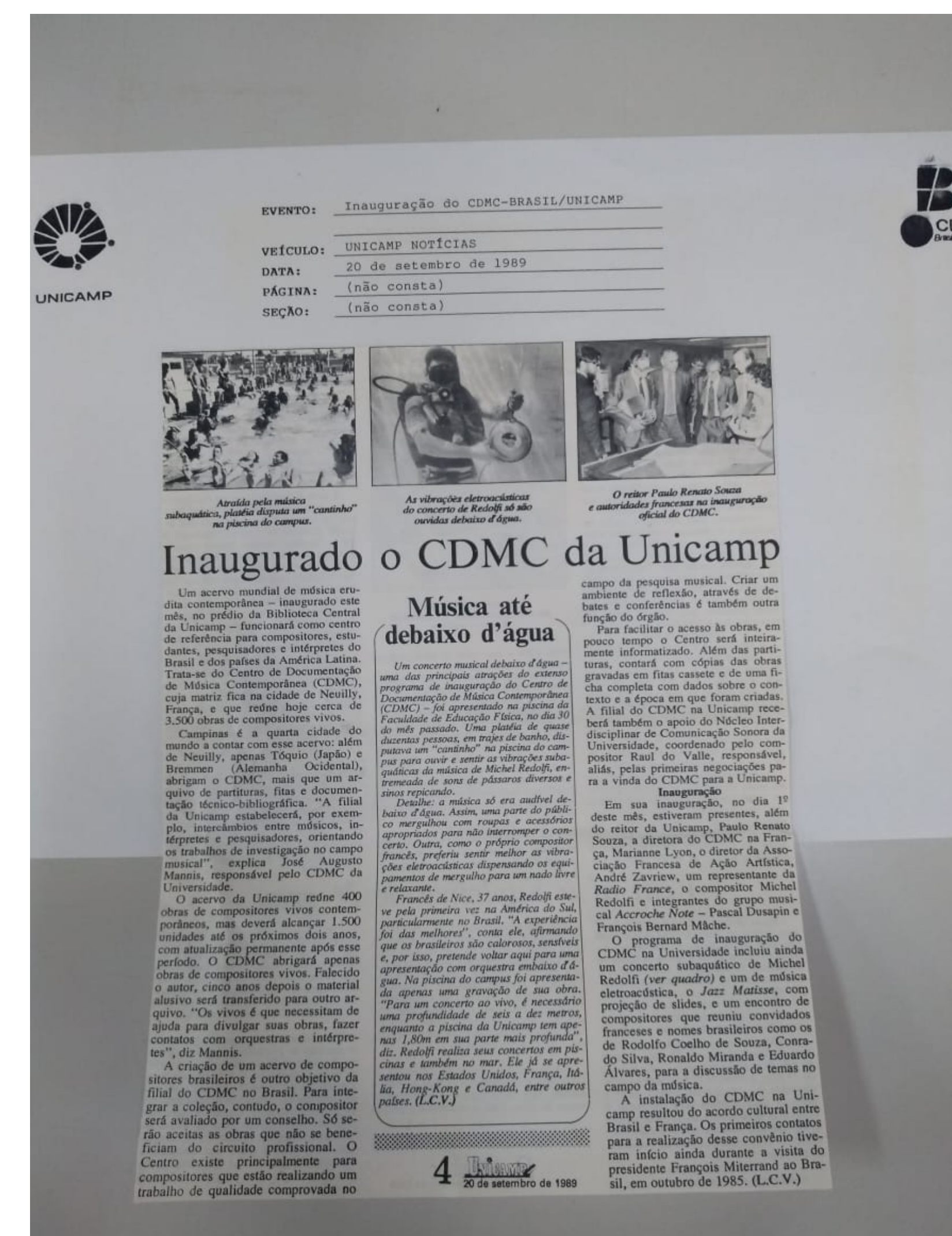
Inauguração do CDMC em 20/09/1989

Referências: ARQUIVO NACIONAL (BRASIL). Declaração digital: recomendações para digitalização, restauração, preservação digital e acesso. Rio de Janeiro: Arquivo Nacional, 2021 14 p. (Publicações Técnicas; 63). Disponível em: <https://www.gov.br/arquivonacional/pt-br/canais_atendimento/imprensa/copy_of_noticias/an-participa-de-debate-sobre-preservacao-audiovisual-na-cineop/Declaracao_digital.ANFIAT1.pdf>. Acesso em 22 ago2022 SANTOS, Gildenir Carolino. Acrônimos, siglas e termos técnicos: arquivística, biblioteconomia, documentação, informática. Coautoria de Celia Maria Ribeiro. 2. ed. rev. e ampl. Campinas, SP: Átomo, 2012. 289 p. ISBN 978576701859 (broch.). <https://www.bibliotecadigital.unicamp.br>