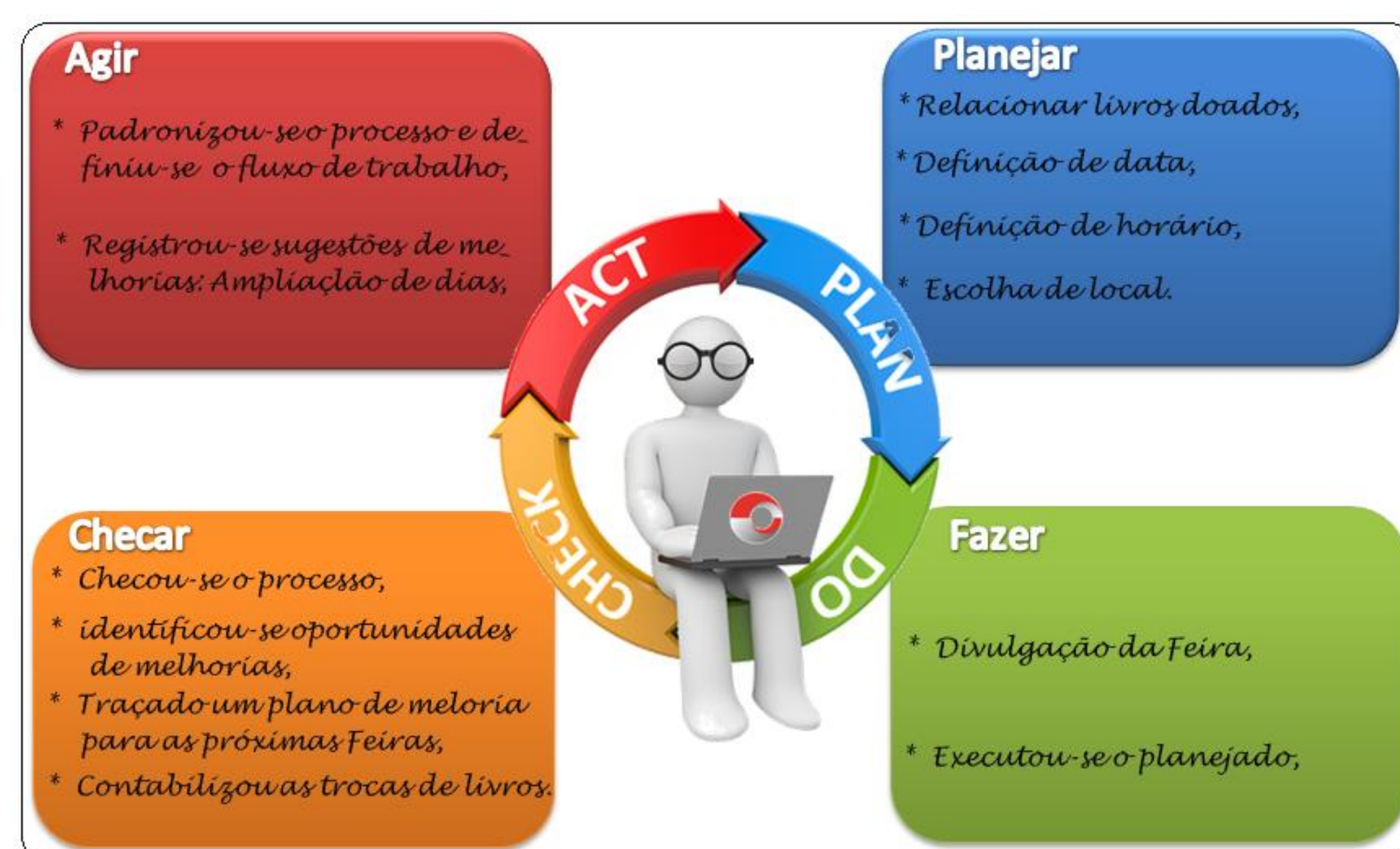
Ferramenta da qualidade PDCA (Planejar, Fazer, Checar e Agir)

O projeto tem grande aceitação e impacto na comunidade do Cotuca, tendo sido abraçado por alunos, funcionários e professores. O projeto atendeu as expectativas imediatas, uma vez que todos os objetivos específicos foram cumpridos e o objetivo geral foi atendido com a troca de livros e o incentivo a leitura. Seguindo a proposta do ciclo PDCA o projeto teve início, meio e fim. Evidentemente que a influência e o impacto cultural do projeto não saberemos onde findará, mas sabemos que se iniciaram.