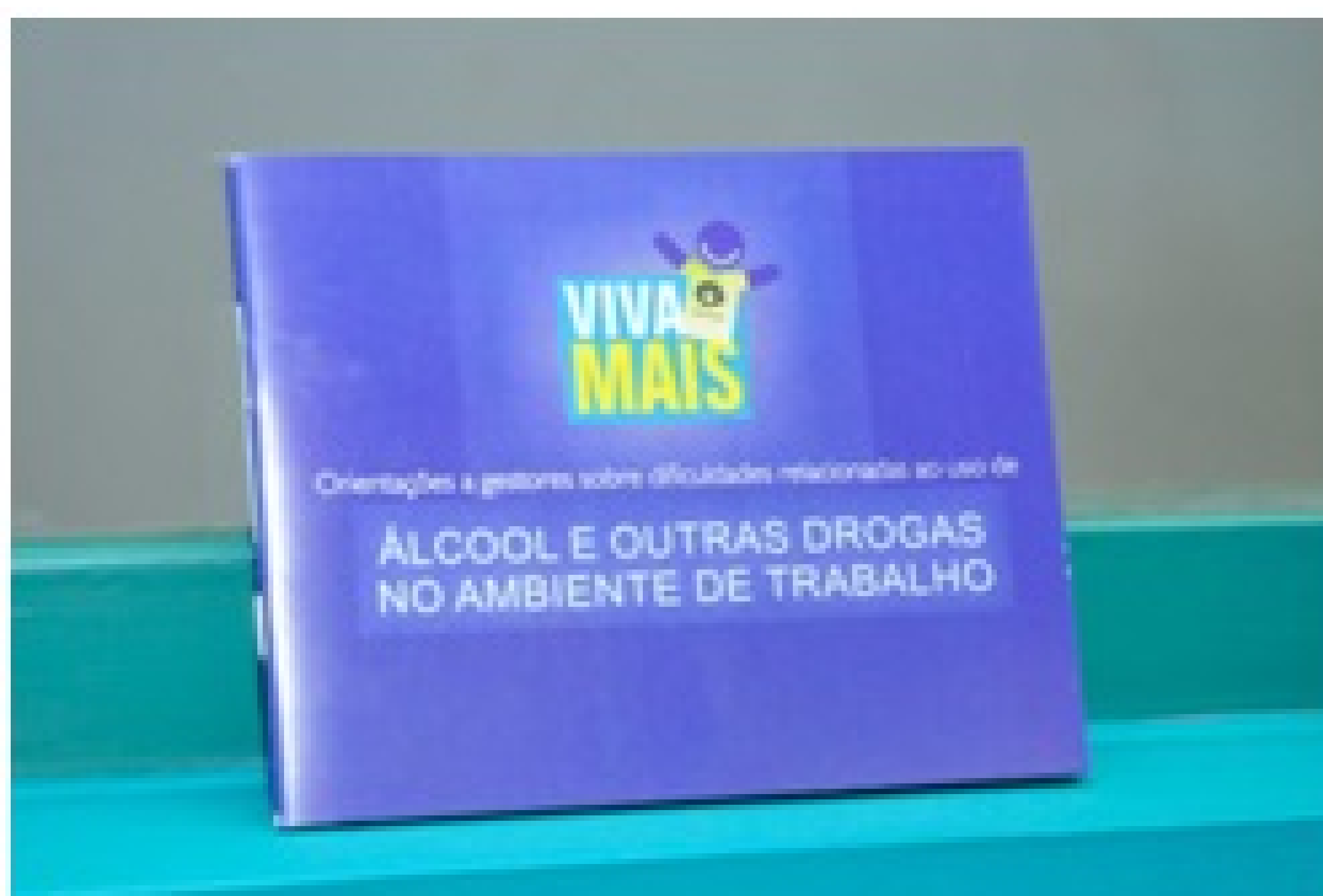
Cartilha de orientação aos gestores

Atualmente, o consumo de substâncias psicoativas (SPAs) passou a ser encarado como um problema complexo, de causa multifatorial e passível de abordagens preventivas e de tratamento, o que vem ressaltar a importância deste trabalho de orientação aos gestores da Universidade, para que possam atuar precocemente diante dos problemas relacionados ao uso de SPAs.