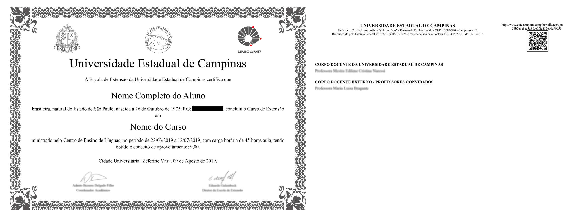
Figura 2: Modelo do novo certificado com assinatura digital

Referências: Medida provisória nº 2.200-2 de 24 de agosto de 2001. Reuniões entre as equipes.