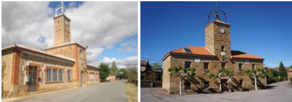
Figura 6: Escuela de Valdespino de Somoza y Escuela de Quintanilla de Somoza.