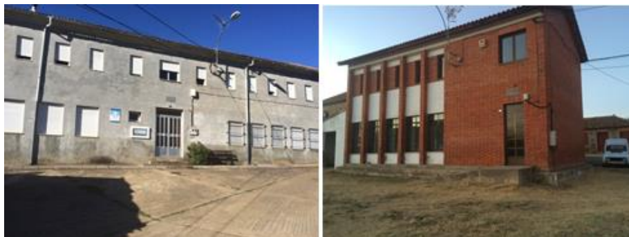
Figura 10 - Escuela de Filiel y Escuela de Niñas de Luyego de Somoza.