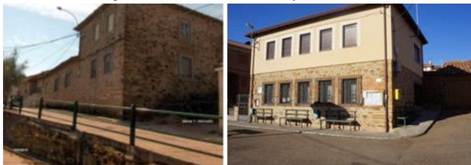
Figura8 - Escuelas de Boisán y Combarros.

de este modelo de construcción, que encontramos en las escuelas maragatas. Esta arquitectura está muy documentada en Aragón y Cataluña, pero poco en esta zona. Destacamos como ejemplo de escuelas-fortaleza las de Requejo-Pradorrey, Rabanal Viejo, Boisán, Viforcós, Pobladura, la Maluenga, Filiel, Combarros, etc.