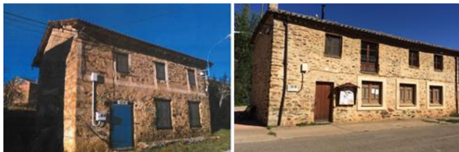
Figura 9 - Escuela de Rabanal Viejo y Requejo-Pradorrey.