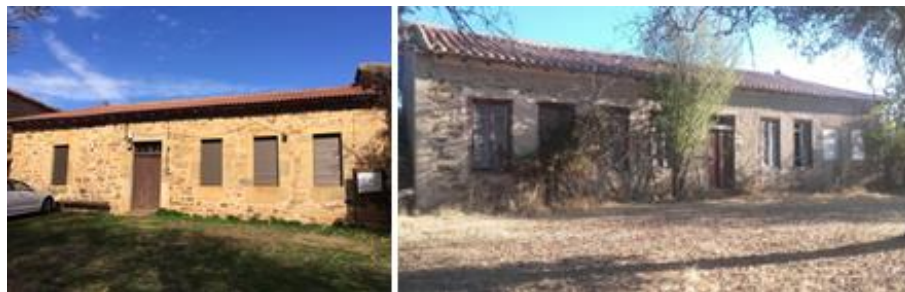
Figura 3 - Escuela de Turienzo de los Caballeros y Villalibre de Somoza