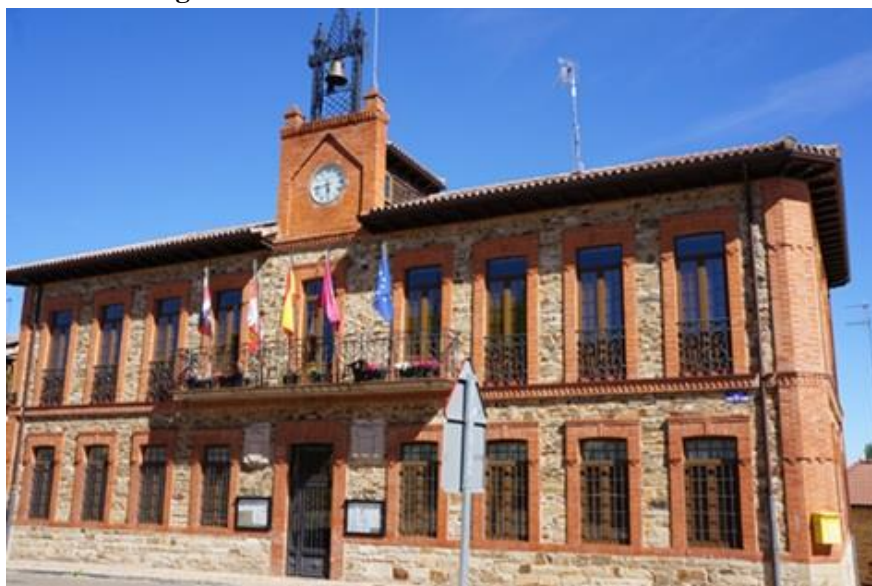
Figura 7 - Escuela de Santa Colomba de Somoza.