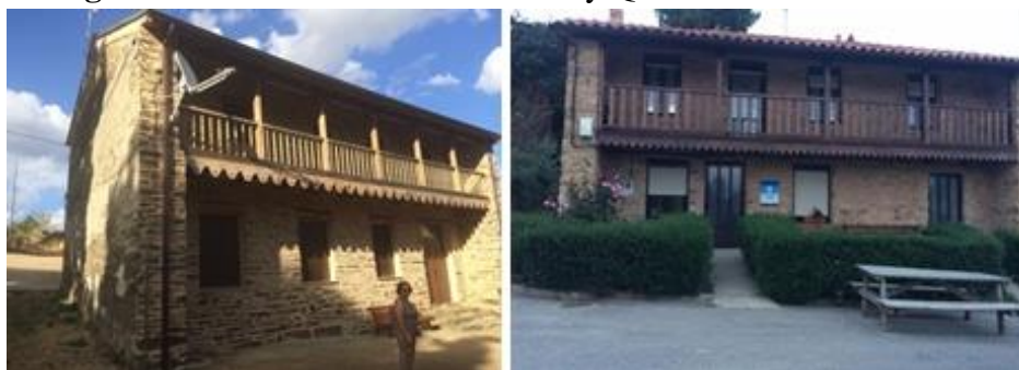
Figura 5 - Escuelas de Piedras Albas y Quintanilla de Combarros.