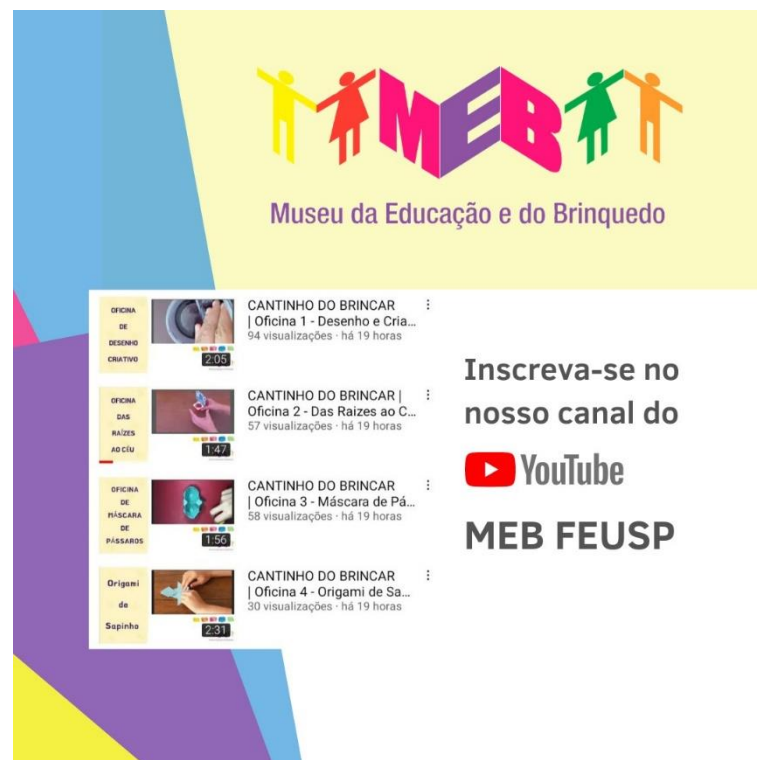
FIGURA 5 - Flyer de divulgação do canal de YouTube com vídeos das oficinas Cantinho do Brincar

Entre 2020 e 2021 o MEB vem desenvolvendo uma série de atividades online, dentre as quais, destacamos a parceria com a Escola de Aplicação (EA) da FEUSP, com a realização de oficinas para os estudantes das séries iniciais. Foram produzidos vídeos curtos com instruções para a preparação de brinquedos e brincadeiras, associados a um roteiro de oficinas desenvolvidas pelas estagiárias e bibliotecária, com atividades síncronas e assíncronas. Os vídeos também foram disponibilizados no canal YouTube do MEB ( https://www.youtube.com/channel/UCjzItfkI6pzpCgGj7e7B0Pw/featured ), lançado durante a Semana dos Museus, em maio de 2021.