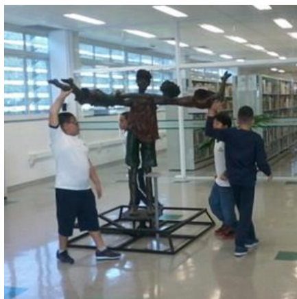
FIGURA 3 - Ações educativas em visitas monitoradas no MEB. A esquerda, crianças manipulando uma escultura da exposição Cenas Infantis e à direita oficina de construção de brinquedos realizada ao final da visita