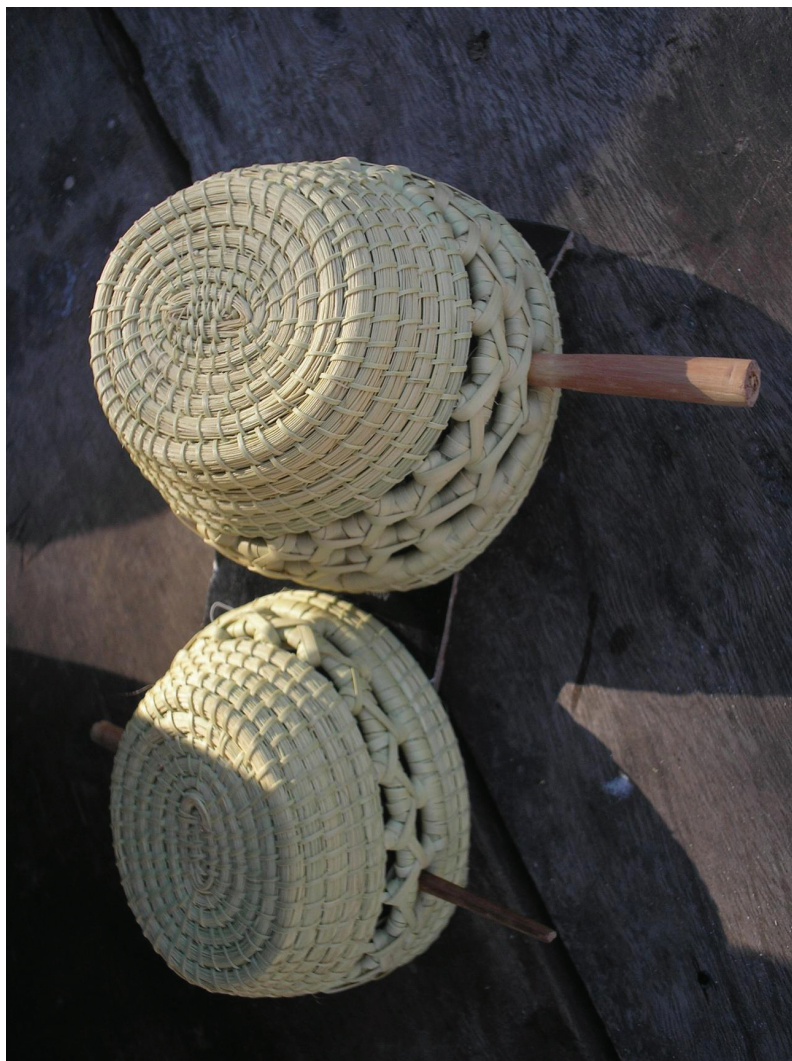
Figura 4. Hebilla con la técnica de espiral (la base) y llana (el borde) de manera combinada. Septiembre, 2010.

La relevancia del estudio de la cestería pilagá se debió a tres factores: en primer lugar, es elaborada por la mayoría de las artesanas; en segundo lugar, son las artesanías pilagá mayormente comercializadas y con las que los pilagá son relacionados más directamente por los no-aborígenes. Por último, ya durante el estudio de los usos territoriales pilagá en mi formación doctoral (MATARRESE, 2011), la producción artesanal comenzaba a esbozarse como una actividad muy relevante en torno a la cual se articulaban y se ponían de manifiesto, tal como sostiene Eagleton (2006), articulaciones parentales, solidaridades de género, valoraciones al interior del conjunto de mujeres autoidentificadas como “artesanas” y diversos procesos jerarquizadores al interior de este grupo, así como estrategias que activamente evitaran dichas diferenciaciones internas.