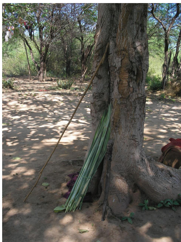
Figura 2. “Palo gancho”, machete y un paquete con el carandillo recolectado. Septiembre, 2010.

La cestería o noonek es elaborada por las pilagá, con una fibra vegetal denominada carandillo o qatalaguá ( Trithrinax biflabellata ). Este material es obtenido por las mujeres durante sus recorridos por el monte, mediante machete y “palo gancho” —es un palo largo con una cuña en uno de los extremos, con el que las mujeres enganchan las hojas más altas y erectas (como se aprecia en la Figura 2). Las hojas más requeridas son las que están en el centro de la palma, dado que son las más largas y están en mejor estado.