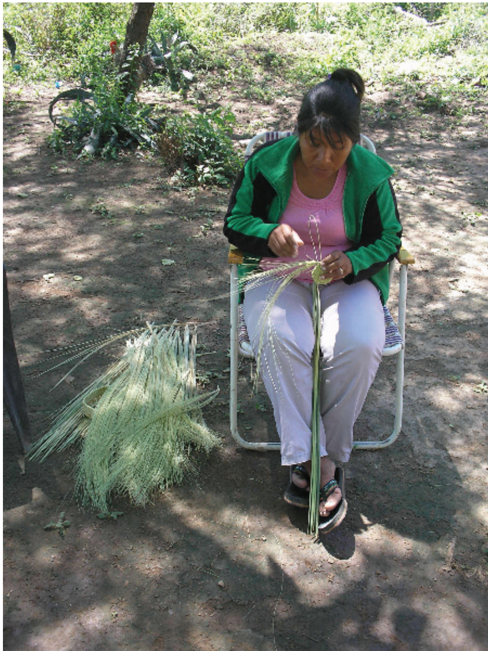
Figura 3. Una colaboradora elaborando una hebilla con la técnica de espiral y llana. Septiembre, 2010.

Estas artesanías se comienzan por la base y a partir de allí se levanta la pieza sin molde, utilizando técnicas como la llana y la coiled o espiral. Para estas técnicas se requiere que las hojas se separen longitudinalmente para obtener “cintas” de un centímetro o dos de ancho con las que efectuar el trenzado. En la llana se entrelazan dos elementos activos —urdimbre y trama— que están formados por el mismo material y tamaño. La espiral, única técnica cestería que se diferencia de otras aplicadas en el textil, consiste en una puntada vertical que se ajusta a un elemento pasivo que actúa de base y está dispuesto en forma horizontal (Figura 3 y 4). Para la realización de la pieza utilizando esta última técnica se necesitan hojas secas y fibras frescas que, a manera de hilo, permitan “coser” la pieza (ARENAS, 2003; PEREZ DE MICOU, 2003; PITLA LASEPI..., 2004).