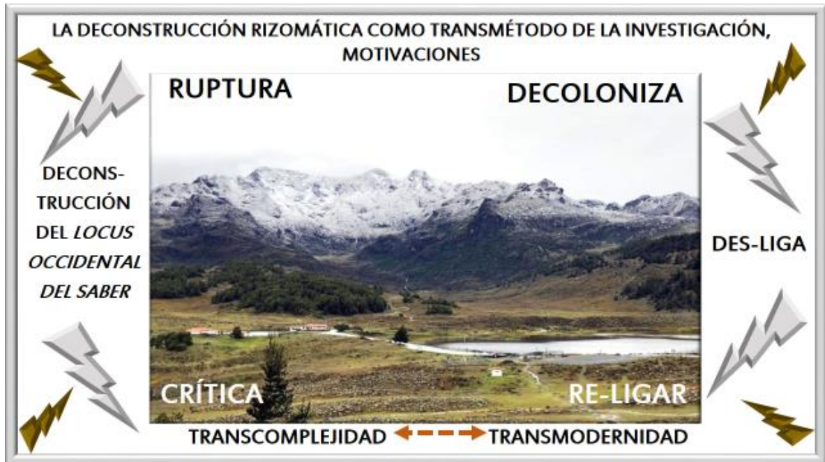
Figura 1: La desconstrucción rizomática como transmétodo de la investigación, motivaciones, realizada para la investigación 2020.

En lo que sigue presentamos un gráfico que da ideas esenciales del presente rizoma: