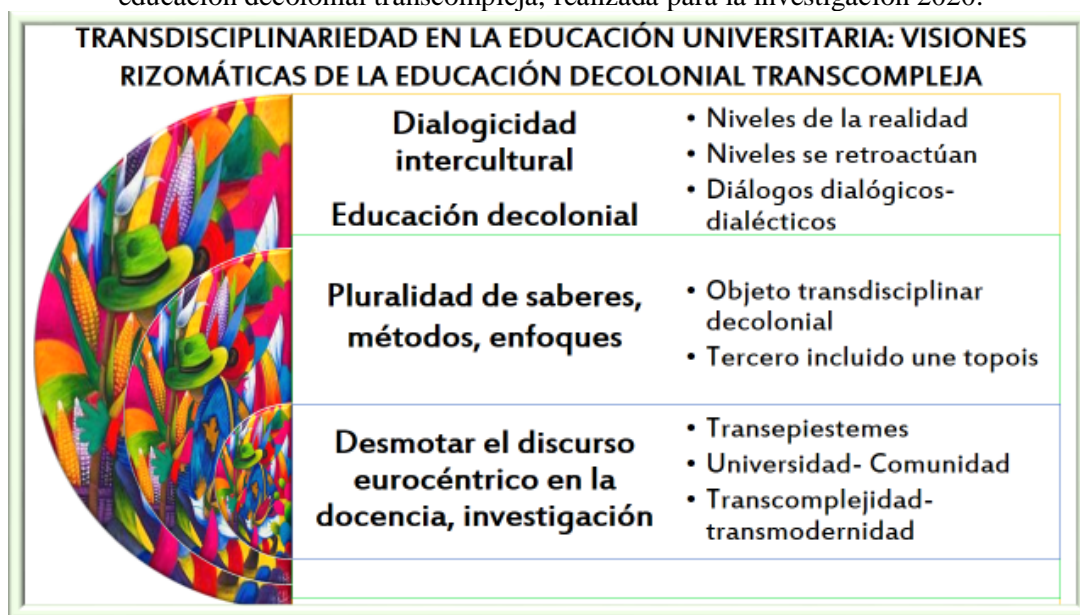
Figura 3: Transdisciplinariedad em la educación universitaria: visiones rizomáticas de la educación decolonial transcompleja, realizada para la investigación 2020.

En lo que sigue presentamos un gráfico que da ideas esenciales del presente rizoma.