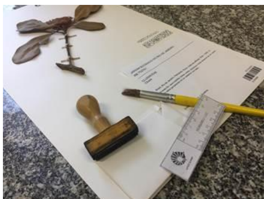
Figura 1. Exsicata de Clusia trabalhada pelas alunas.

As alunas trabalharam com plantas da família CLUSIACEAE, do gênero Clusia . Os materiais foram montados, fotografados, editados e seus dados foram disponibilizados on-line no site do CRIA.