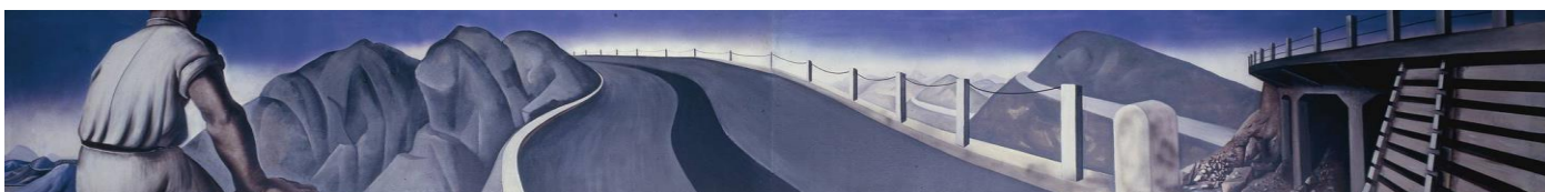
Figura 5: Cândido PORTINARI (1903-1962). Construção da Rodovia (painel IV de IV). 1936. OST. 96x768 cm. Local indefinido.