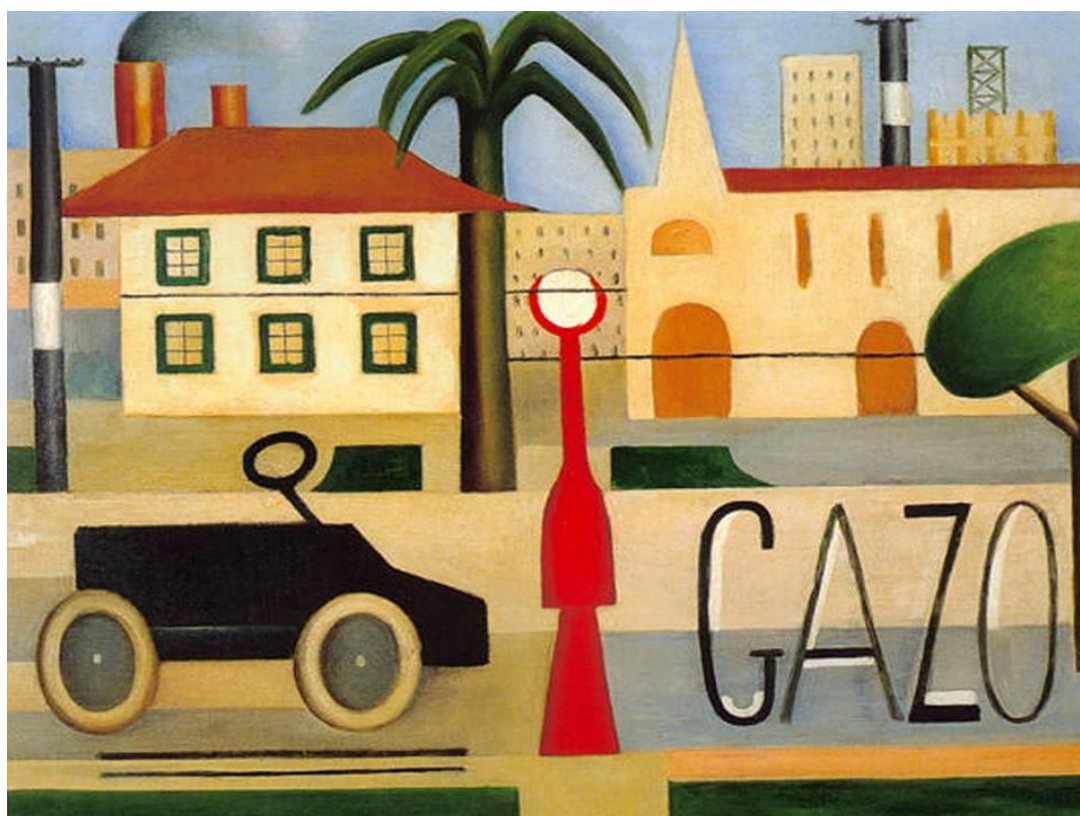
Figura 2: TARSILA do Amaral (1886-1973). São Paulo [GAZO] . 1924. 50x60cm. Coleção Particular.