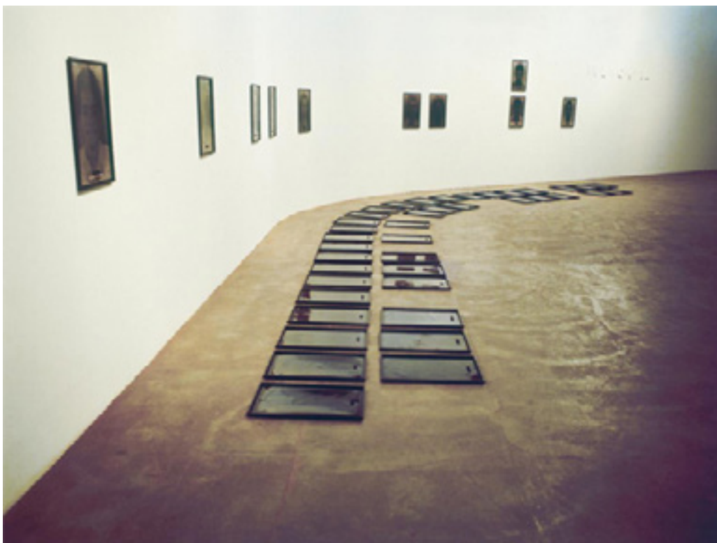
PFig. 1 – (1994), Rosângela Rennó, Imemorial. Quarenta retratos em película ortocromática pintada e dez retratos em C-Print sobre bandejas de ferro e parafusos, 60x40x20 cm (cada fotografia) e letras de metal pintado sobre paredes. Instalação na Galeria Athos Bulcão, Brasília. Coleção Marcos Vinícius Vilaça (Brasília/Recife). Foto: cortesia da artista; [O arquivo universal e outros arquivos] (livro).