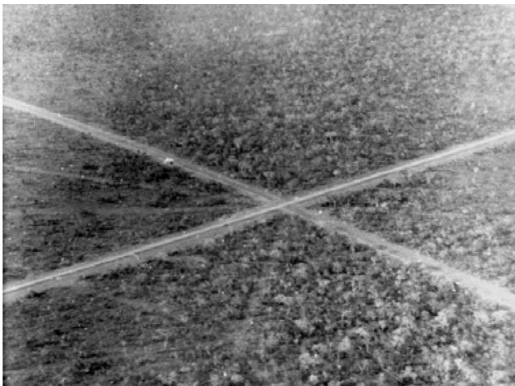
Fig. 4 – (1957), Mário Fontenelle, fotografia do cruzamento do Eixo Monumental e do Eixo Rodoviário. Acervo Mário Moreira Fontenelle/Museu Vivo da Memória Candanga, Brasília. Fonte: Minha mala, meu destino (livro).