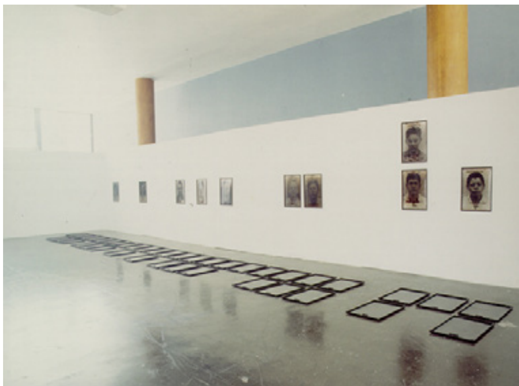
ig. 2 – (1995) Rosângela Rennó, Imemorial. Instalação no Edifício Gustavo Capanema, Rio de Janeiro. Coleção Marcos Vinícius Vilaça (Brasília/Recife).