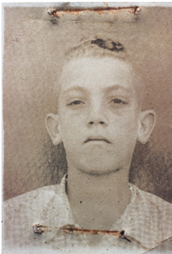
Fig. 5 – (1994-95), Rosângela Rennó, Imemorial (Detalhe - N. 19781 – Profissão: Servente. Contratado aos 12 anos).