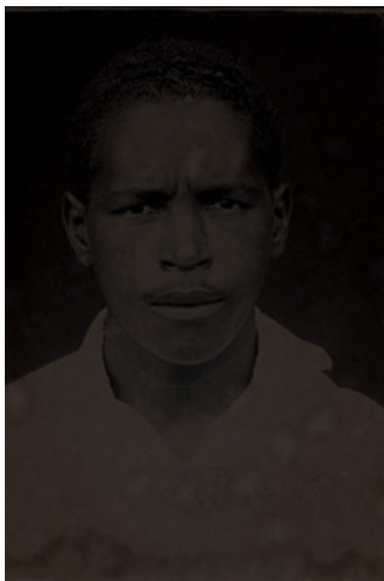
Fig. 6 – (1994-95), Rosângela Rennó, Imemorial (Detalhe - N. 3497 – Profissão: Braçal. Falecido aos 25 anos). Fonte: www.rosangelarenno.com.br (website da artista); Revendo Brasília (catálogo da exposição).