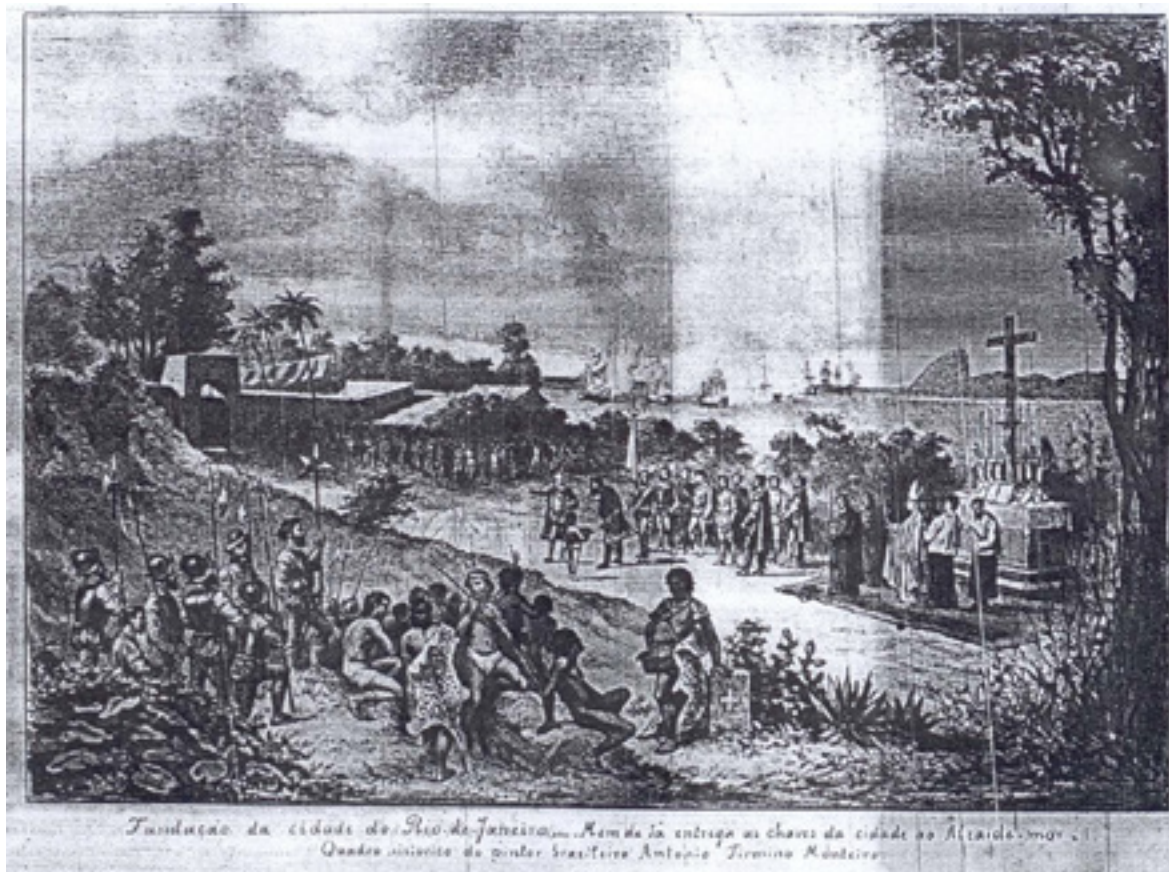
Revista Illustrada, RJ, 1882, N.297, p.8 (Reprodução do quadro de Firmino Monteiro “Fundação da Cidade do Rio de Janeiro”).