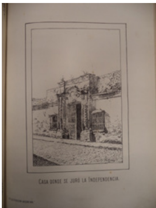
La Ilustración Argentina, N.11, 20/09/1881. Eduardo Sívori (1847-1918). Fachada da casa onde em 9 de julho de 1816 foi jurada a independência da Argentina em Tucumán. a Ilustración Argentina, N.11, 20/09/1881.