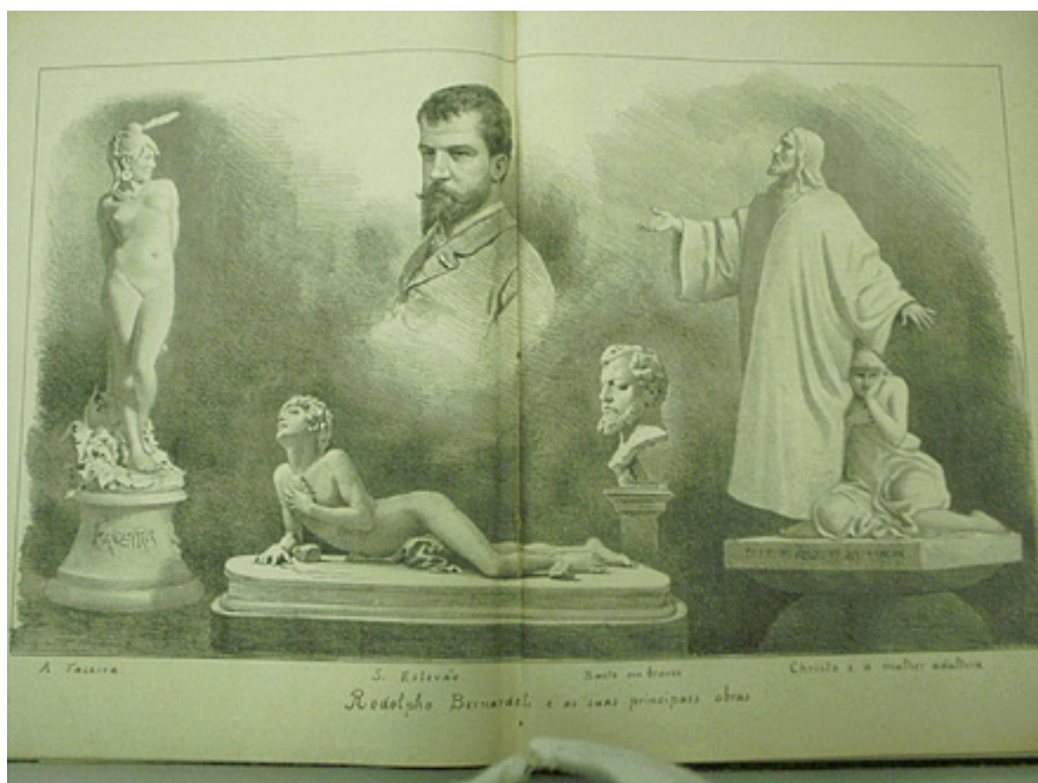
Revista Illustrada, RJ, n.420, 1885, p.4 e 5 (Retrato e obras de Rodolfo Bernardelli)