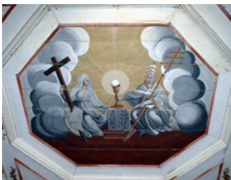
Imagem 3. Séc. XIX (primeiro quartel). Artista ainda não identificado. Alegoria da Fé e da Igreja . Ó.s.m. Forro do nártex, ou vestibulo, da Igreja Matriz de Santo Antônio de Itaverava, MG.