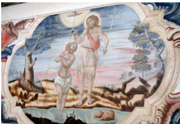
Imagem 2. Séc. XVIII. João Batista de Figueiredo. Batismo de Cristo (Detalhe) . Ó.s.m. Forro do vestibulo, ou nártex, da Matriz de Santo Antônio. Santa Bárbara, MG.