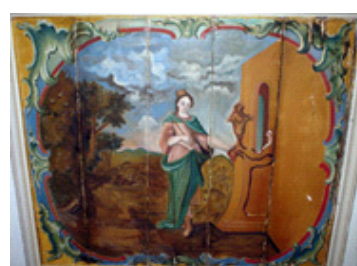
Imagem 7. Séc. XVIII. Artista ainda não identificado. Mulher sábia: Ester (?) . Ó.s.m.. Forro do nártex, ou vestibulo, da Igreja Matriz de Prados, MG.