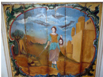
Imagem 5. Séc. XVIII. Artista ainda não identificado. Mulher sábia: Judite . Ó.s.m.. Forro do nártex, ou vestibulo, da Igreja Matriz de Prados, MG.