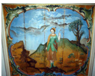
Imagem 6. Séc. XVIII. Artista ainda não identificado. Mulher sábia: Sara . Ó.s.m.. Forro do nártex, ou vestibulo, da Igreja Matriz de Prados, MG.