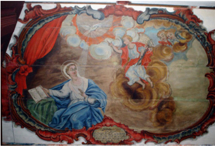
Imagem 8. 1792. João Batista de Figueiredo. Anunciação . Ó.s.t. Forro do nártex, ou vestíbulo, da Capela da Irmandade do Rosário de Santa Rita Durão, distrito de Mariana, MG.