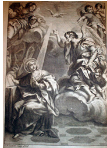
Imagem 9. 1781. Nicolau José Batista Cordeiro. Anunciação . Estampa. Missale Romanum . Lisboa: Regia Officina Typographica.