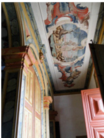
Imagem 1. Séc. XVIII. João Batista de Figueiredo. Batismo de Cristo . Ó.s.m. Forro do vestibulo, ou nártex, da Matriz de Santo Antônio. Santa Bárbara, MG.