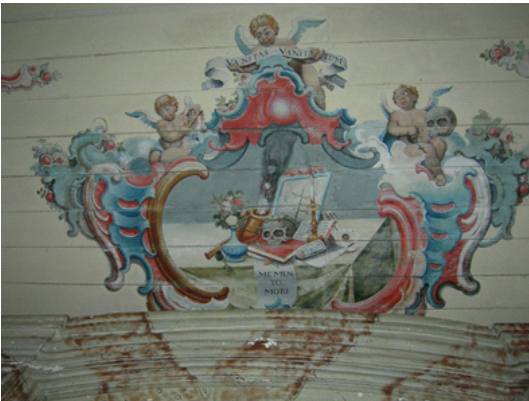
Imagem 10. Primeiro quartel do séc. XIX. Manuel da Costa Ataíde. Vanitas . T.s.m. Forro do nártex, ou vestíbulo da Igreja de São Francisco de Assis. Ouro Preto, MG.