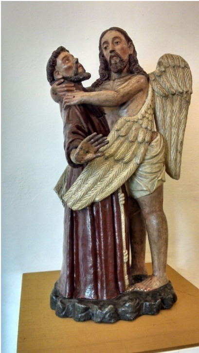
Figura01.jpg. Desconhecido. São Francisco das Chagas. Século XVII. Barro cozido e policromado, 99 cm. Museu de Arte Sacra de São Paulo (MAS-SP).