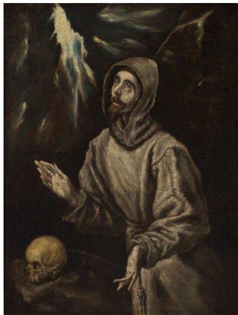
Figura04.jpg. El Greco, Domenikos Theotokopoulos. Êxtase de São Francisco com os Estigmas. Por volta de 1600. Óleo sobre tela, 72 X 55 cm. Museu de Arte de São Paulo Assis Chateaubriand (MASP).