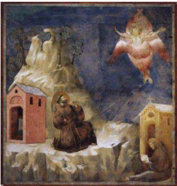
Figura03.jpg. Giotto. São Francisco recebe os estigmas. 1290-1292. Afresco, 270 X 230 cm (?). Basílica de São Francisco, Assis, Itália.