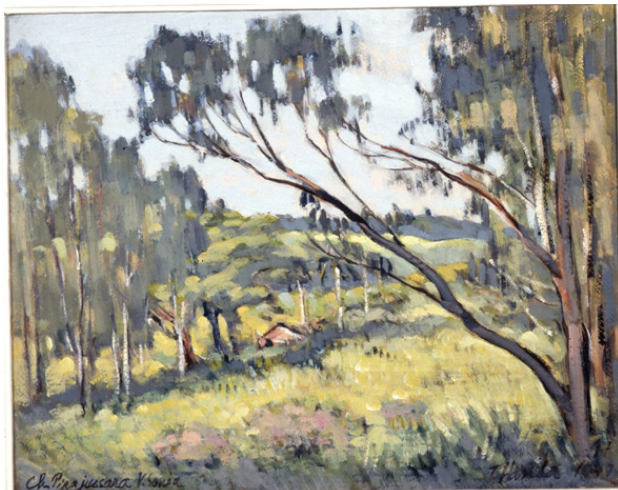
Figura 08.jpg --> HANDA, Paisagem da Vila Sônia, 1947.