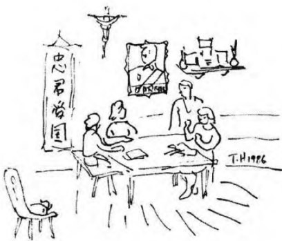
Figura 06.jpg --> HANDA, 1987, p. 593.