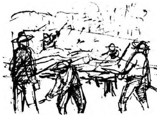
A limpeza do terreno após a queimada.