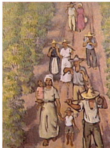
Figura 09.jpg --> HANDA. A colheita de café, sem data.