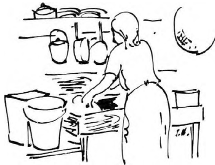
Na casa do imigrante, a influência japonesa, como a pia da cozinha.