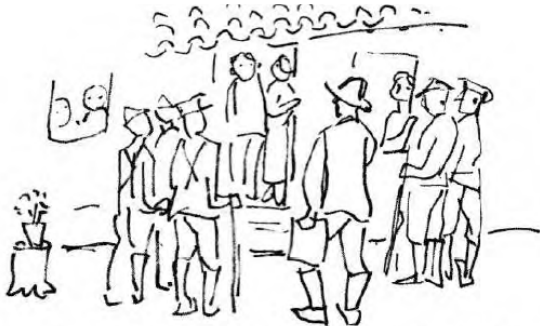
Nos núcleos, os colonos tiveram problemas relativos à posse de terras e foram molestados pelas autoridades policiais.