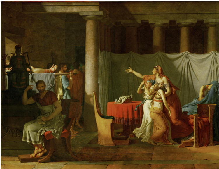
figura03.jpg --> Jacques Louis David. Os lictores devolvendo a Brutus os corpos de seus filhos (1798). Óleo sobre tela. Museu do Louvre- Paris.