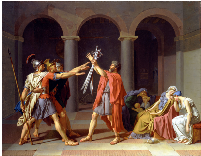
figura02.jpg --> Jacques Louis David. O Juramento dos Horácios (1784). Óleo sobre tela. Museu do Louvre - Paris.