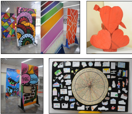
Exposição itinerante Ilustrando o mundo pela EJA : Trabalhos em exposição na BCCL e na Biblioteca Prof. Joel Martins/FE, de autoria de alunos do projeto Educação de Jovens e Adultos (EJA) da Prefeitura de Campinas.

No mês de novembro, a Biblioteca Prof. Joel Martins da Faculdade de Educação (FE) e a Biblioteca Central Cesar Lattes (BCCL) sediaram atividades da Mostra e exposição itinerante Ilustrando o Mundo pela EJA . O evento faz parte dos projetos realizados em parceria pelo Grupo de Estudos e Pesquisas em Educação de Jovens e Adultos (GEPEJA) da FE, pelo Núcleo de Ação Educativa Descentralizada Noroeste da Prefeitura de Campinas (NAED Noroeste), pela Biblioteca Prof. Joel Martins e, em 2017, também pela BCCL.