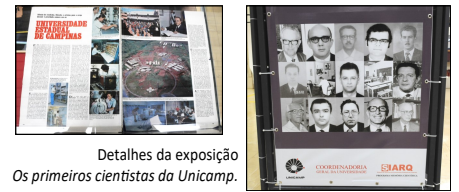
Detalhes da exposição Os primeiros cientistas da Unicamp .

10/17/fca-promove-semana-nacional-do-livro-e-da-biblioteca. )