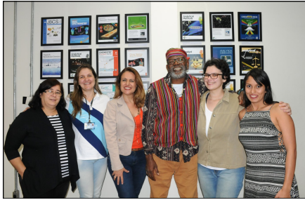
Equipe da BIQ junto à mostra de capas de periódicos.

Como parte das atividades comemorativas dos 50 anos do Instituto de Química (IQ) da Unicamp, a biblioteca da unidade (BIQ)